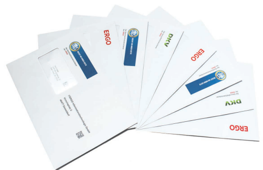
Kuverts passend zum Inhalt mit Logos, Bildern oder Botschaften bedruckt