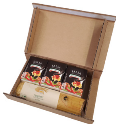
Muster einer Schachtel mit Inhalt