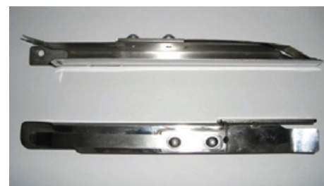
Einpackschuhe in der Größe von 13 mm