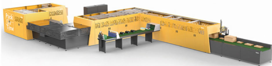
Die MI750 ist ab Dezember 2018 für Vorführungen im Schweizer Stammhaus verfügbar.