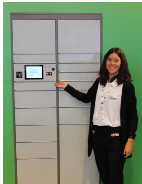
Das Kern City Terminal ist auch kombinierbar mit einem Kühl- und Gefrierterminal