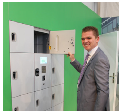
Kern Home Terminal – extrem flexibel und leicht!